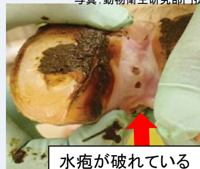
水疱が破れている

毎日必ず健康観察 し、これらの症状を見つけ次第、直ちに 獣医師 や最寄りの 家畜保健衛生所 に 連絡 しましょう。