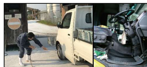
車両はタイヤだけでなく、 泥よけの内側まで消毒 し、 フロアマットの交換やペダル等車内も消毒