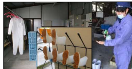
専用の服や靴の使用、手指消毒