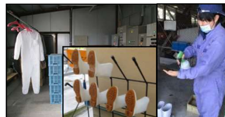
専用の服や靴の使用、手指消毒