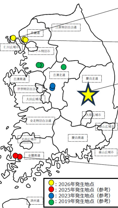
2026年7月6日時点 農林水産省動物衛生課

注：日付はWOAH報告の発生日 頭数は当該農場で飼養されている感受性動物数