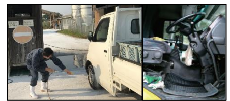
車両はタイヤだけでなく、 泥よけの内側まで消毒 し、 フロアマットの交換 や ペダル等車内も消毒