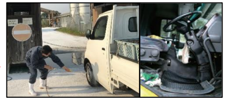
車両はタイヤだけでなく、 泥よけの内側まで消毒 し、 フロアマットの交換 や ペダル等車内も消毒