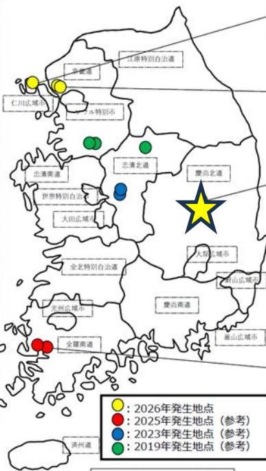
2026年7月6日時点 農林水産省動物衛生課

注：日付はWOAH報告の発生日 頭数は当該農場で飼養されている感受性動物数