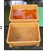
推奨される踏込消毒槽の設置方法！